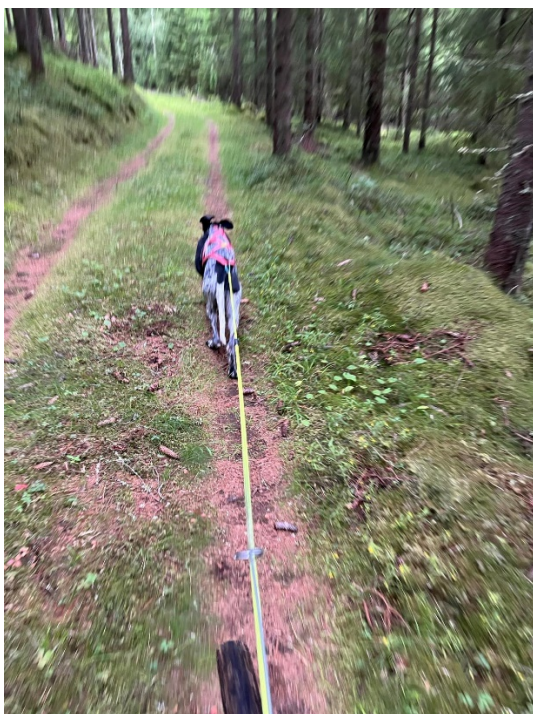
Sista delen av "mördarbecken".