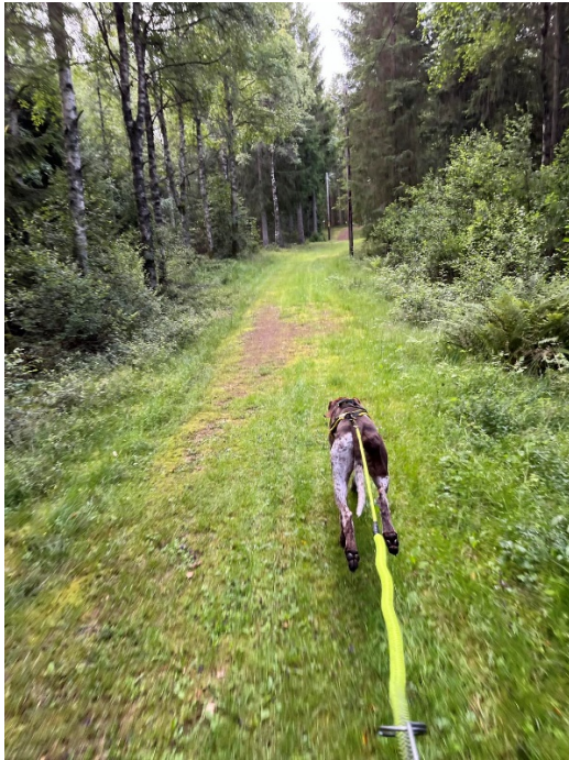
Ut från starten, första delen av elljusspåret.