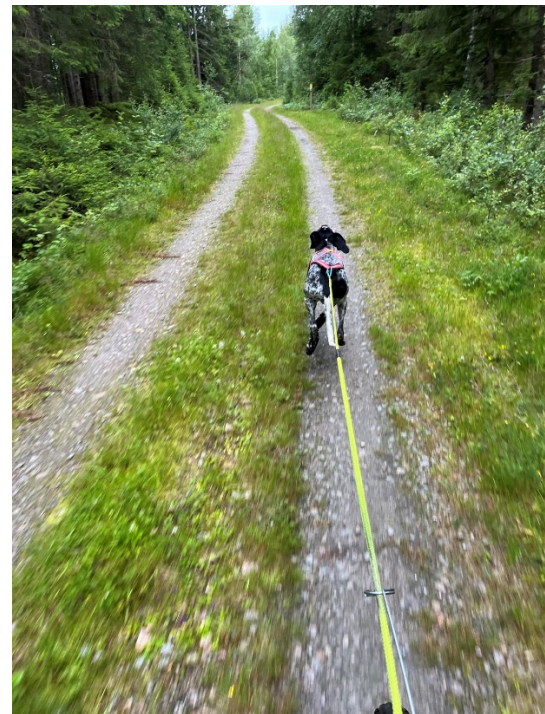
Övre delen av grusvägen.