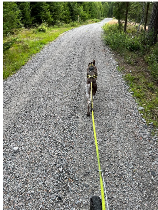
Nedre grusvägen med ny beläggning som börjar sätta sig riktigt bra.