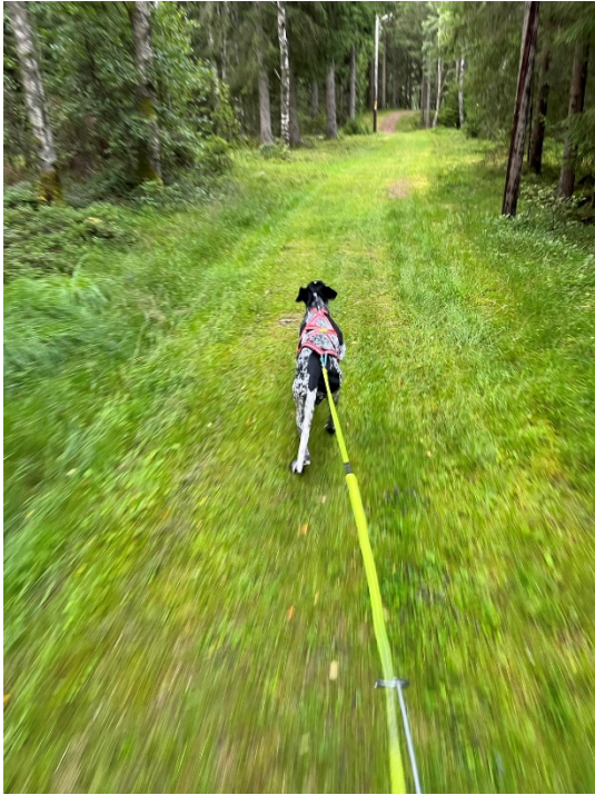
Avlutande elljusspåret in mot mål.